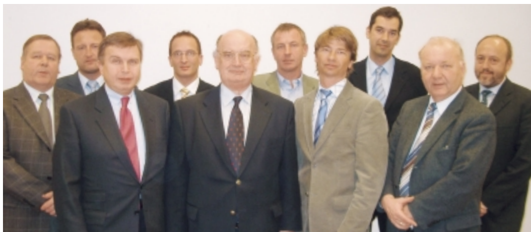
Die Vertreter der ARGE Pharmazeutika-Mitgliedsfirmen

Eine Prognose für die nächsten 50 Jahre wäre unseriös, aber für einen Zeitraum von rund zehn Jahren wünsche ich mir, dass wir uns nicht dorthin entwickeln, wo der Lebensmittelgroßhandel